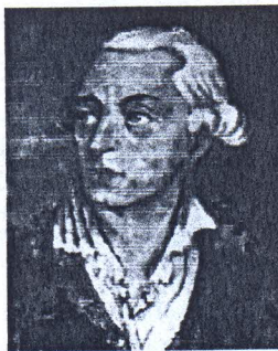
C.G. Langhans -Syn Ziemi Kamiennogórskiej

fragment parteru. Sylwetkę artystyczną Langhansa w znacznym stopniu ukształtowały podróże. W roku 1765 zwiedził południowe Niemcy, a w latach 1768-1769 Włochy. Kilka lat później udał się także do Anglii, Belgii, Holandii i Francji. Nieliczne notki biograficzne podają rok 1770 jako ten, w którym architekt po raz pierwszy odwiedził Berlina. Tutaj, kilka lata później, za sprawą nominacji nadanej przez króla Fryderyka II, objął funkcję dyrektora Dworskiego Urzędu Budowlanego, a także tajnego doradcy dworu do spraw wojny. Wcześniej (od 1776r.) piastował urząd radcy budowlanego we Wrocławiu i Głogowie. Pobyt w Berlinie okazał się dla Langhansa okresem bardzo twórczym. W 1794r. powrócił na pewien czas do Wrocławia, gdzie realizował jedno z powierzonych mu zadań budowlanych. Zmarł w roku 1808 w stolicy Dolnego Śląska.